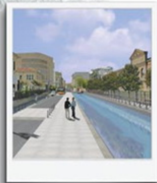
Come potrebbe essere Via Francesco Sforza tra l'entrata del Policlinico e l'Università Statale. La zona potrebbe essere a "traffico limitato" (ZTL).