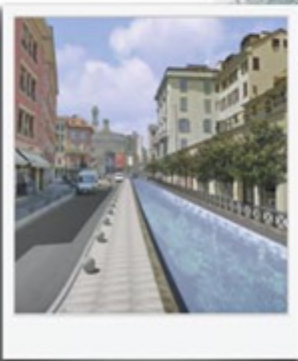
Una possibile visione di Via Molino delle Armi , tra piazza Vetra e l'incrocio con Corso Di Porta Ticinese. Sullo sfondo la chiesa di Santa Maria alla Vittoria.