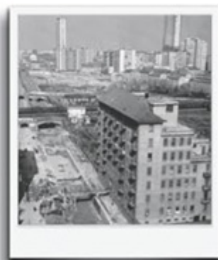
La chiusura del Naviglio Martesana in Via Melchiorre Gioia, negli anni '50, vista dal centro (angolo Via Monte Grappa), verso la periferia. Sullo sfondo a destra si vede chiaramente il "Pirellone".