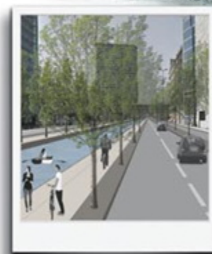
L'immagine di Via Melchiorre Gioia , con il Naviglio Martesana che scorre al centro del grande viale, in prossimità dei palazzi della Regione e del Comune di Milano.

RIAPRIRE I NAVIGLI. UN INVESTIMENTO. NON UN COSTO.